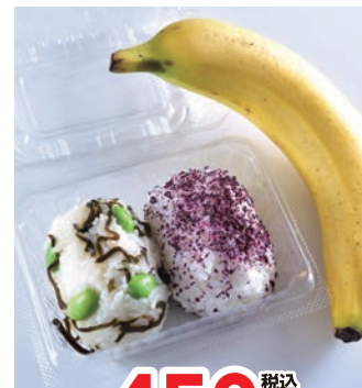
25 各450円 税込