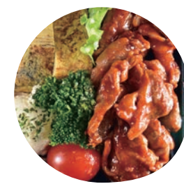
18 ポークチャップ弁当