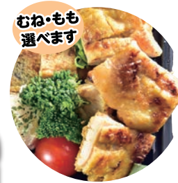
16 タンドリーチキン弁当