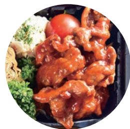
⑤ ポークチャップ弁当