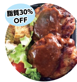
17 豆腐ハンバーグ弁当