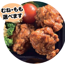
むね・もも 選べます