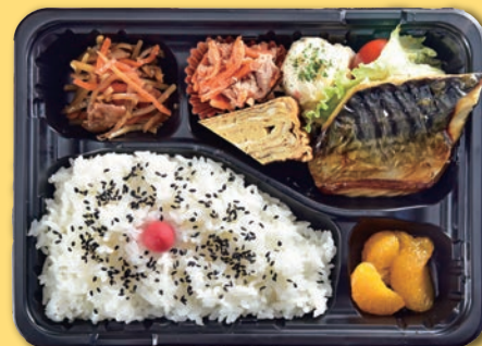
⑩ 焼き魚弁当 サバ・シャケ・サワラの中から選べます