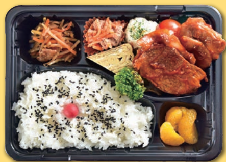
⑪ ロースポークチャップ弁当