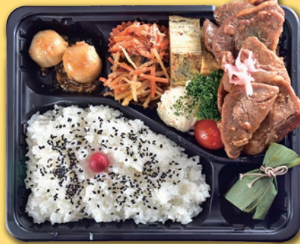
24 ロース生姜焼き弁当