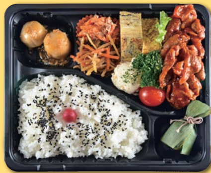
23 ロースポークチャップ弁当