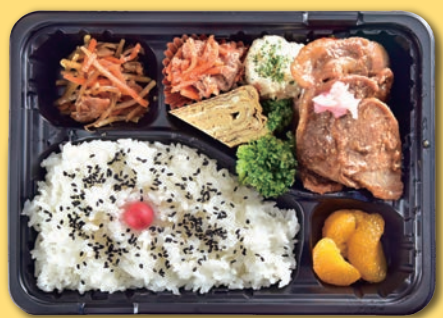
⑫ ロース生姜焼き弁当