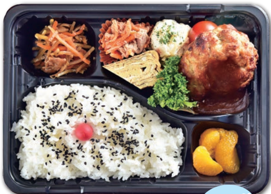
① 豆腐ハンバーグ弁当 脂質30% OFF