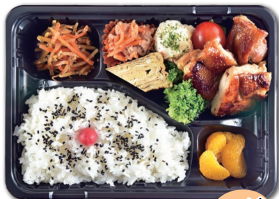
② 鶏の照り焼き弁当 むね・もも 選べます