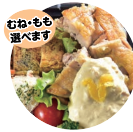
21 健康チキン南蛮弁当