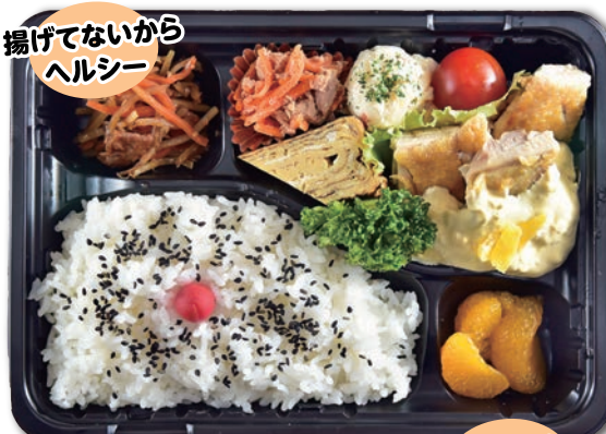
⑨ 健康チキン南蛮弁当 むね・もも 選べます

油で揚げずに焼いたジューシーな鶏肉を、特製のタルタルソースでお楽しみいただけます。健康を意識した一品で、食べ応えもバッチリです。新鮮な野菜とのバランスも考えられた一食を、ぜひご賞味ください。